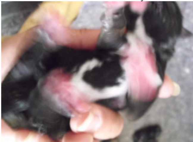
y3 – Hündin dunkelzobel oder black & tan