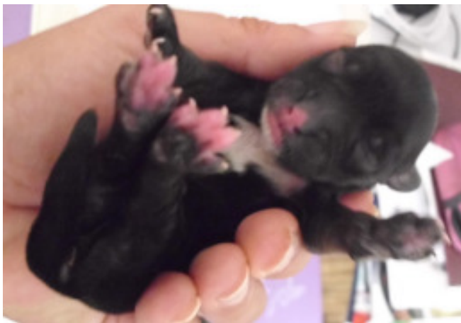
y7 – Rüde dunkelzobel oder black & tan

Mama sowie Babys hatten wenig Sinn für Bilder! Bald gibt es bessere Fotos. LG – TIBET TERRIER Y-Wurf von Tila-La