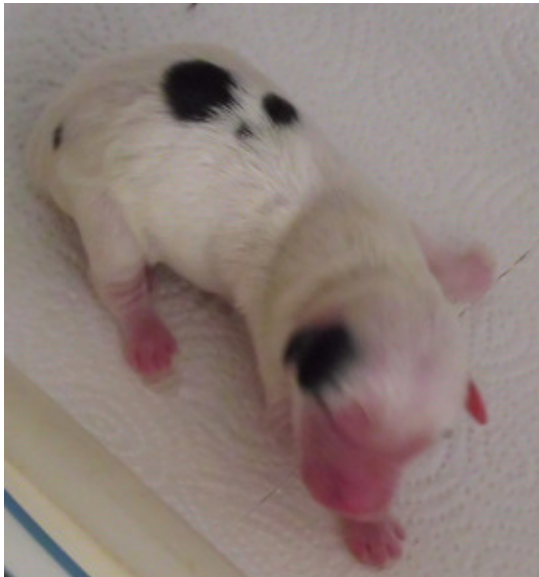
y4 – Rüde weiss mit Abzeichen