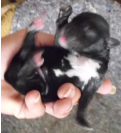
y2 – Rüde dunkelzobel oder black & tan